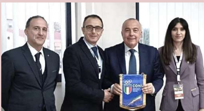
da sx.: Falcione, Suliani, Parrinello, Corona

Il "Cerimoniale" rappresenta uno degli aspetti più delicati e significativi nell'organizzazione di eventi sportivi e istituzionali: dietro ogni premiazione, cerimonia di apertura o momento ufficiale, esistono regole precise che garantiscono ordine, rispetto delle istituzioni e una comunicazione efficace. Conocerle e applicarle correttamente significa valorizzare l'evento e tutte le realtà coinvolte. Questo è stato l'obiettivo della proficua giornata di formazione organizzata dalla Scuola Regionale del CONI Molise, in collaborazione con l'ANSMes Molise e UNISPORT, che ha visto la partecipazione di un illustre relatore, il Generale di Brigata della Guardia di Finanza Vincenzo Parrinello, già Comandante dei Gruppi Sportivi delle Fiamme Gialle che, grazie alla sua competenza, simpatia e cordialità, ha reso particolarmente coinvolgente l'approfondimento del protocollo del cerimoniale sportivo negli eventi nazionali e internazionali: un vero e proprio viaggio all'interno di un ambito tanto complesso quanto fondamentale. All'incontro hanno partecipato dirigenti sportivi, sindaci e amministratori comunali, tecnici e operatori del settore, accomunati dall'interesse ad approfondire una tematica trasversale che unisce diversi ambiti istituzionali e sportivi. Al Generale Parrinello sono andati i più sinceri ringraziamenti per aver contribuito alla perfetta riuscita dell'iniziativa coordinata dalla dott.ssa Katia Corona, vice Presidente